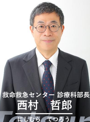
救命救急センター 診療科部長