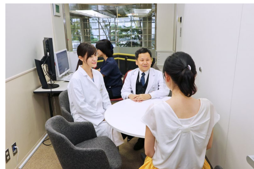
遺伝カウンセリング風景