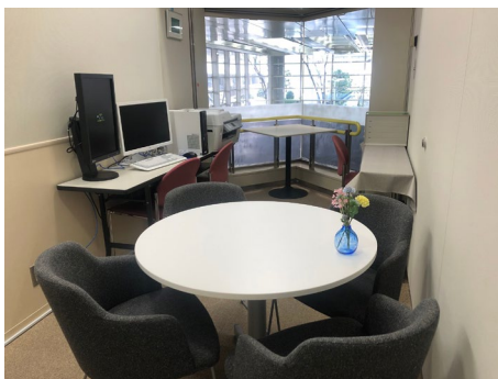
遺伝カウンセリングルーム