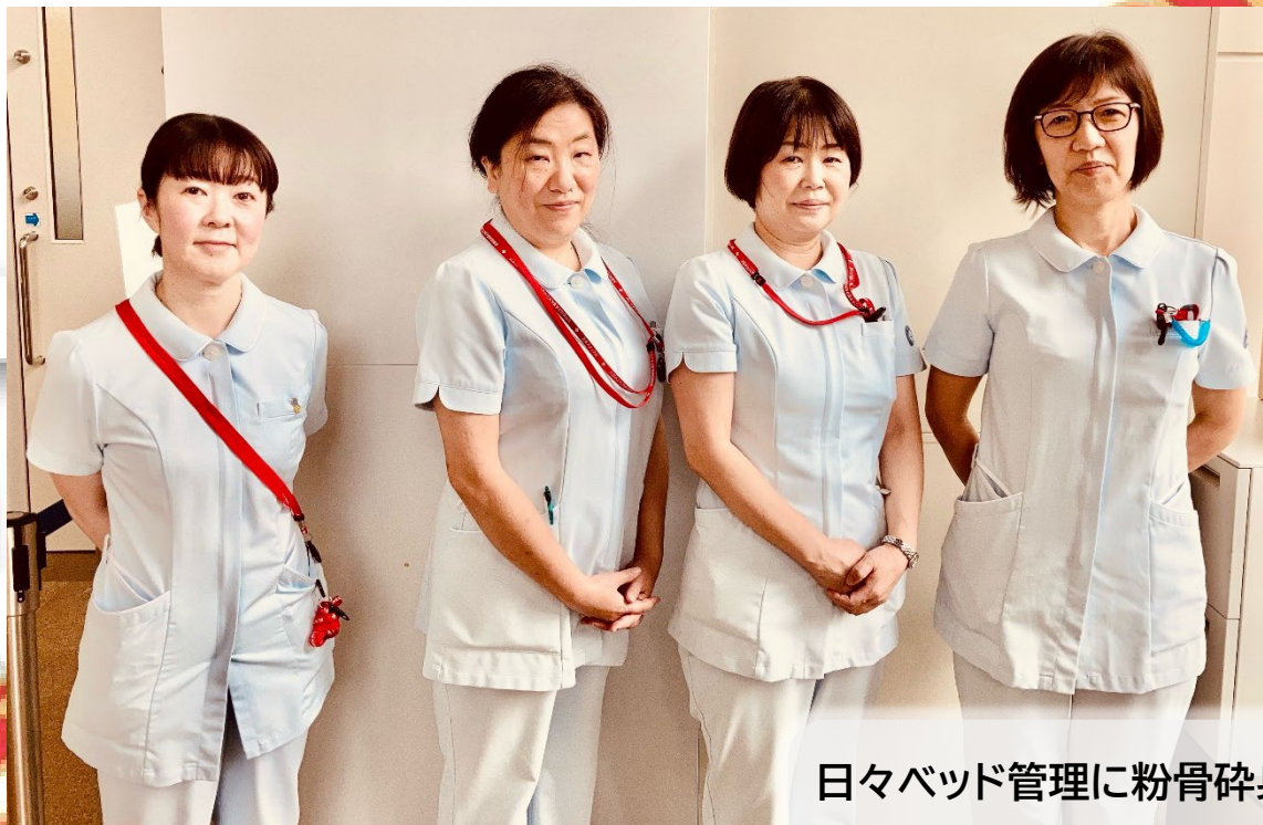
日々ベッド管理に粉骨砕身している